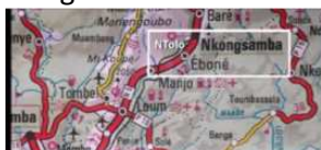
Ntolo Région du Littoral Département du Moungo Arrondissement du Nlonako Ethnie Bakaka