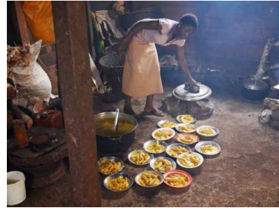
les causeries éducatives